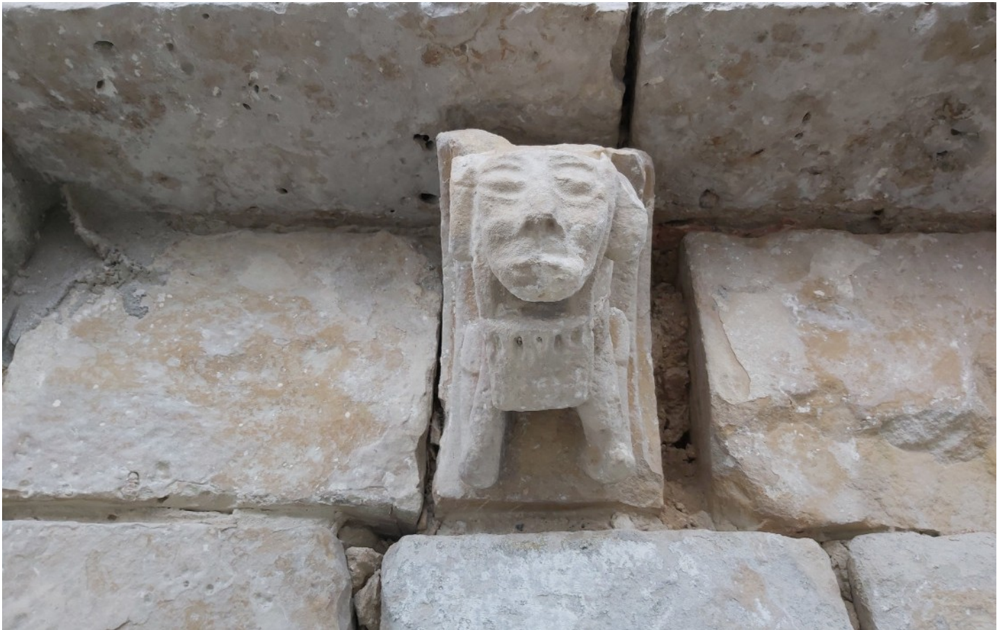
Photographie du monument historique 10n